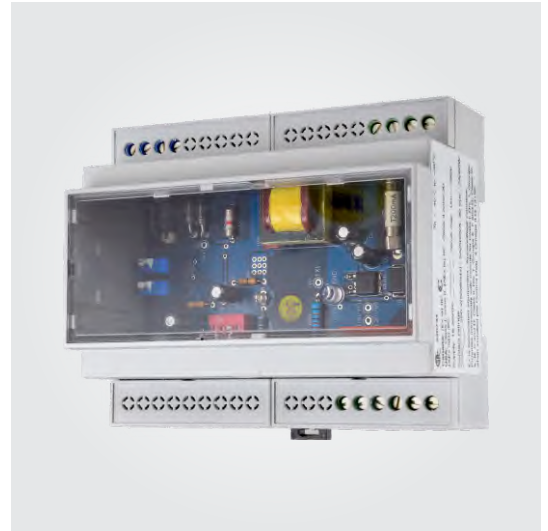
Earth-Rite OMEGA II

Anfrage > Klicken Sie hier, wenn Sie Fragen zum Produkt haben oder ein Angebot wünschen.