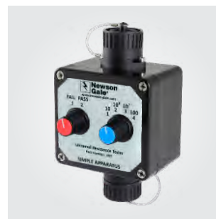
Universal-Widerstandsprüfer Produktcode: URT