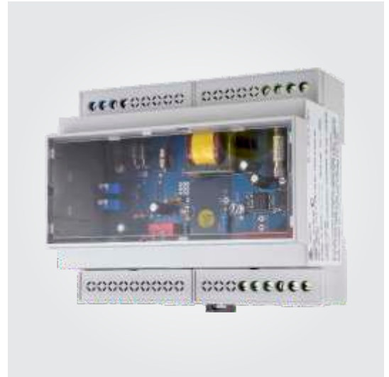
Earth-Rite OMEGA II

Anfrage > Klicken Sie hier, wenn Sie Fragen zum Produkt haben oder ein Angebot wünschen.